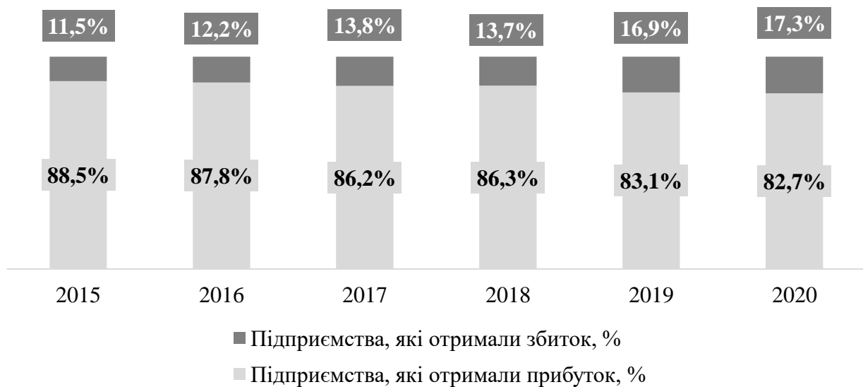
Рис. 2. Розподіл підприємств аграрного виробництва України, що отримували прибуток / збиток у результаті своєї фінансово-господарської діяльності, 2015-2020 рр., %

Примітка: інформація надана за 2015-2020 рр., так як оновлена інформація за 2021 р. на офіційному сайті Державної служби статистики України відсутня.