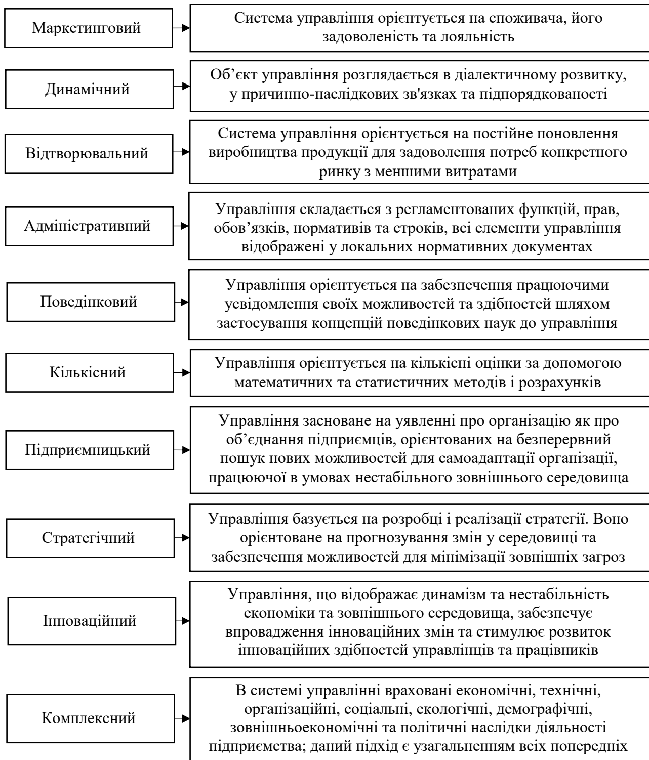
Рис. 4. Підходи до управління підприємством аграрного виробництва Джерело: складено автором на основі (Ястремська, 2020) [9].

враховує всі аспекти, ризики та загрози, передбачає використання регламентації управлінських процедур, використання інноваційних інструментів та стратегічну спрямованість.