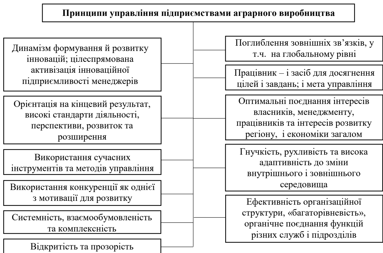
Рис. 3. Ключові принципи управління підприємствами аграрного виробництва в умовах глобалізації економіки та економічної нестабільності

Управління є процесом, що складається з етапів та засновується на певних принципах. Вони визначають особливості існування та функціонування системи управління, знаходячись в її основі (рис. 3).