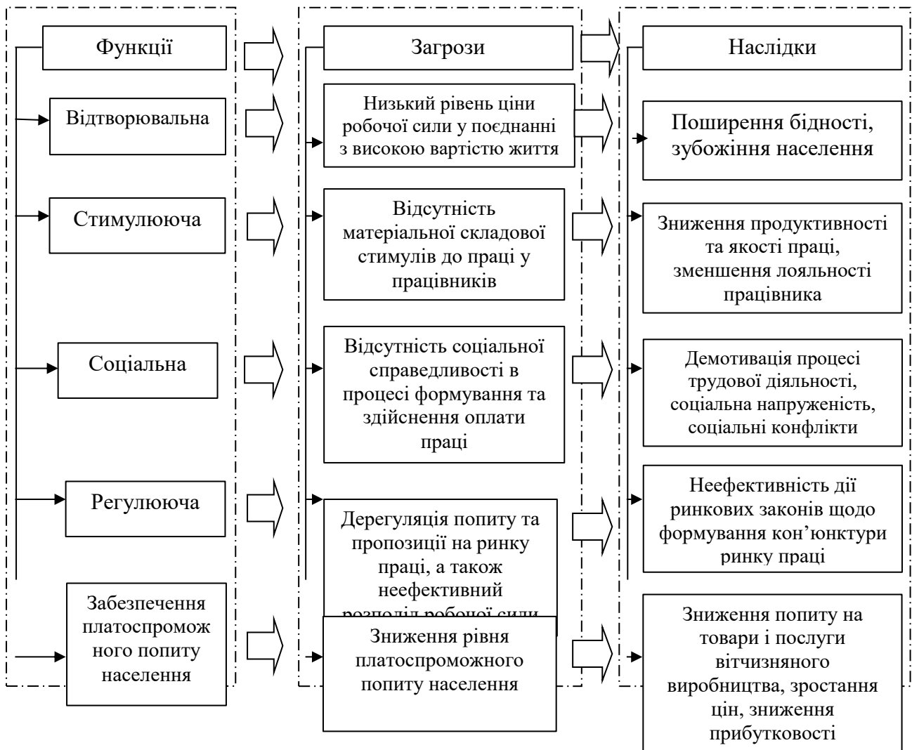
Рис. 1 Загрози безпеці оплати праці та їх наслідки

На жаль, наразі заробітна плата не виконує основні свої функції, формуючи численні загрози та негативні наслідки для держави, суспільства, суб'єктів господарювання та індивіда (рис. 1).